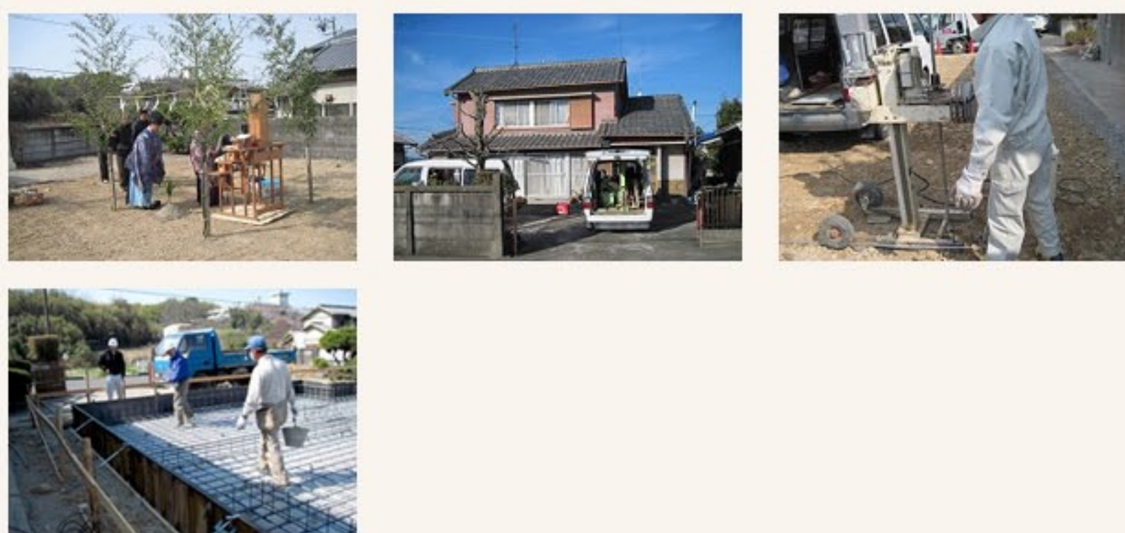
第三者機関による 配筋検査

未曾有の地震には、世界中が震え上がりました。日本の力に復興の支援を願い、祈る思いです。地鎮祭を入念に執り行われました。